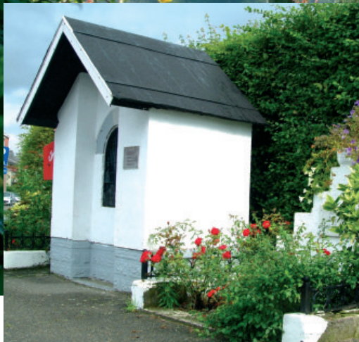
Chapelle St Roch